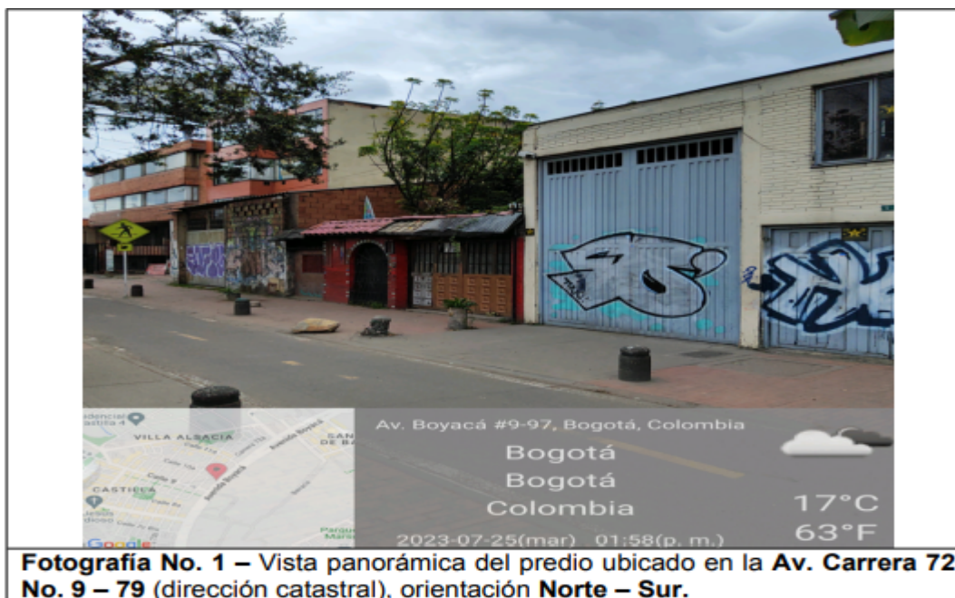
Fotografía No. 1 – Vista panorámica del predio ubicado en la Av. Carrera 72 No. 9 – 79 (dirección catastral), orientación Norte – Sur.